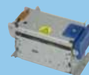
SE1-21 (2 cale)