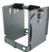
Holder HL3 (φ 200mm)