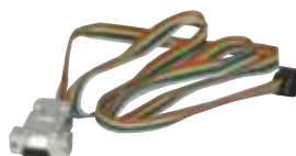
Kabel komunikacyjny CB-SK1-S2