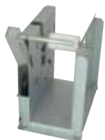
Holder HL1 (φ 200mm)