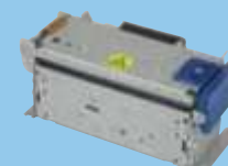
SE1-31 (3 cale)