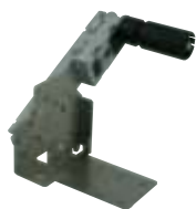
Holder HL2 (φ 200mm)